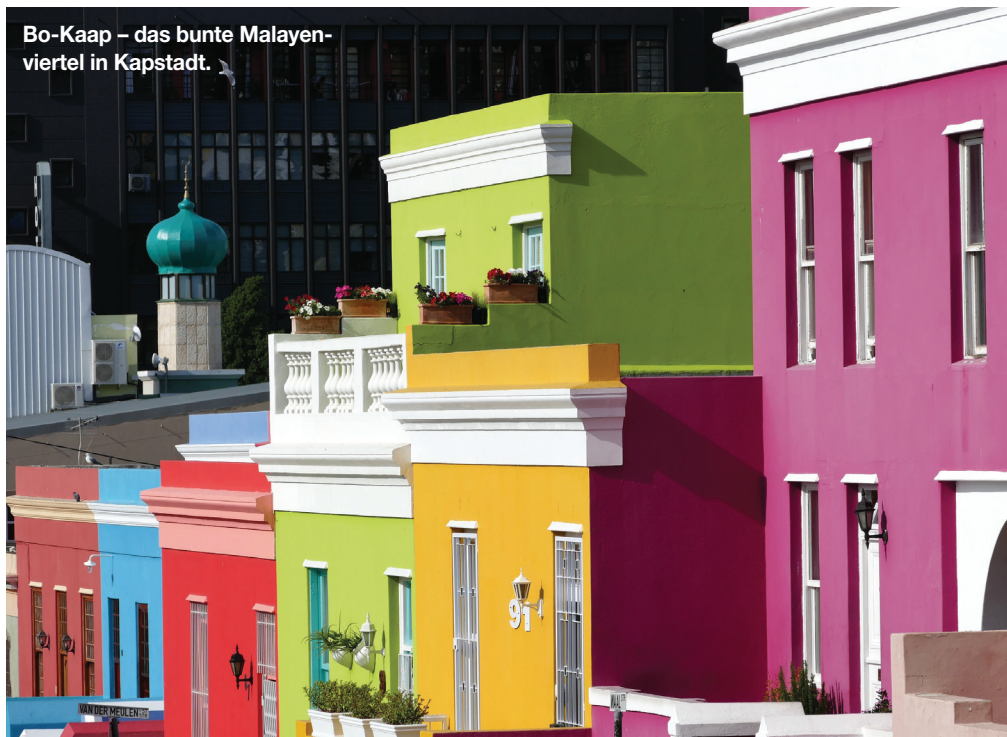
Bo-Kaap – das bunte Malayenviertel in Kapstadt.

Afrika und den Indischen Ozean spezialisiert. Seit ihrer ersten Reise nach Afrika in 2004 lässt sie der Kontinent nicht mehr los. Mit ihrem Reiseveranstalter hat sie den Traum verwirklicht, individuell zusammengestellte Reisen in ihren Lieblingsländern anzubieten. Auf Fisch und Fleisch bloggt sie regelmäßig über ihre Erlebnisse in Afrika. Mehr Infos zu ihren Reisen auf genuss-touren.com